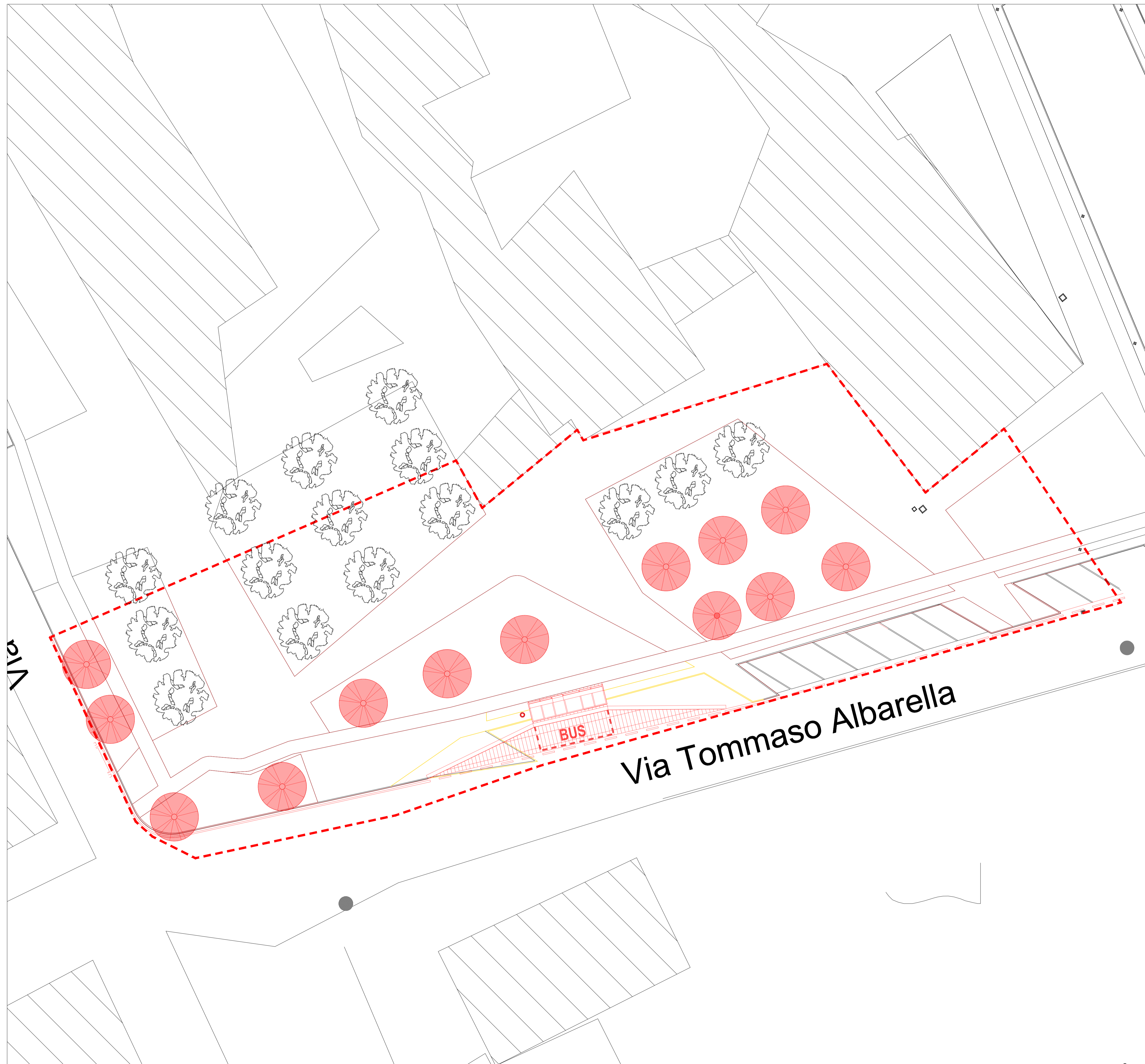
Pianta demolizioni e ricostruzioni - scala 1:200